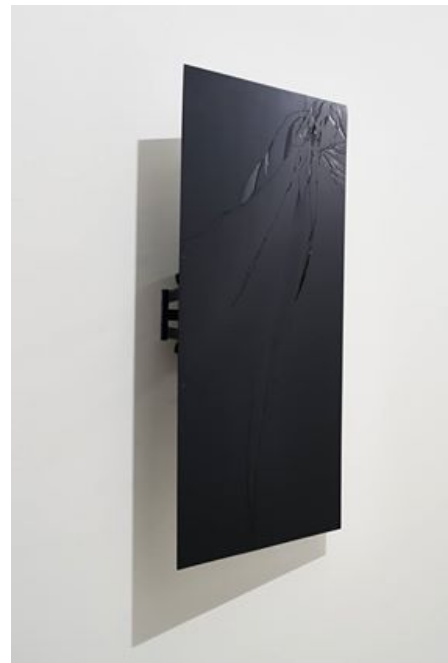
「Black display_#10」 2017

2014 「Duality of existence」Friedman benda gallery(ニューヨーク)