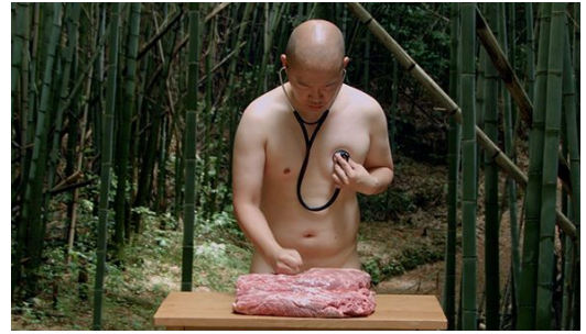
「生きている/生きていない(2017.6/尻海_1)」2017 シングルチャンネル ビデオ、サウンド、10min.00 sec.

2014 「牛窓・亜細亜芸術交流祭」瀬戸内市美術館・牛窓シーサイドホール (岡山)