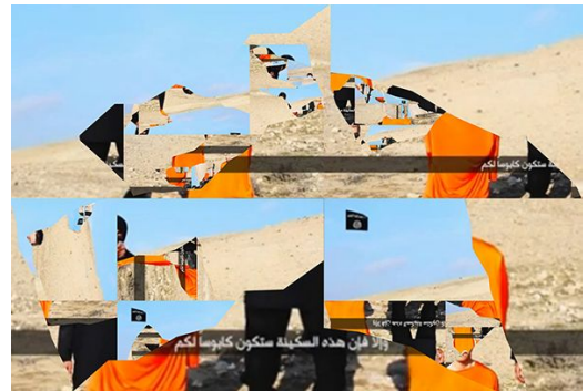
「"anti-index / media poiesis" イスラム国 #7 & #10」 2017 インクジェットプリント、アルミ複合板にマウント